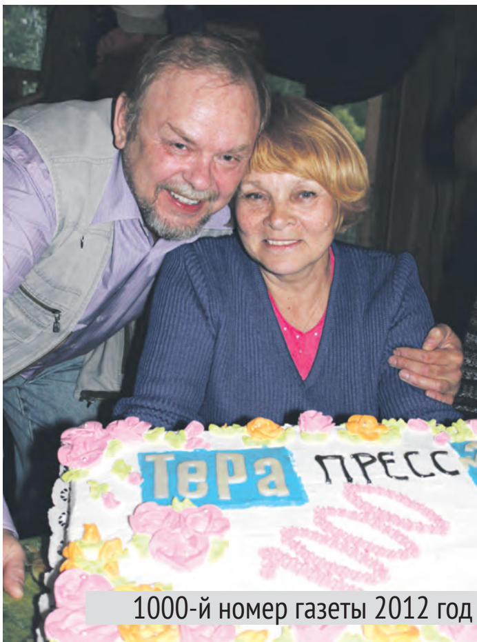
1000-й номер газеты 2012 год