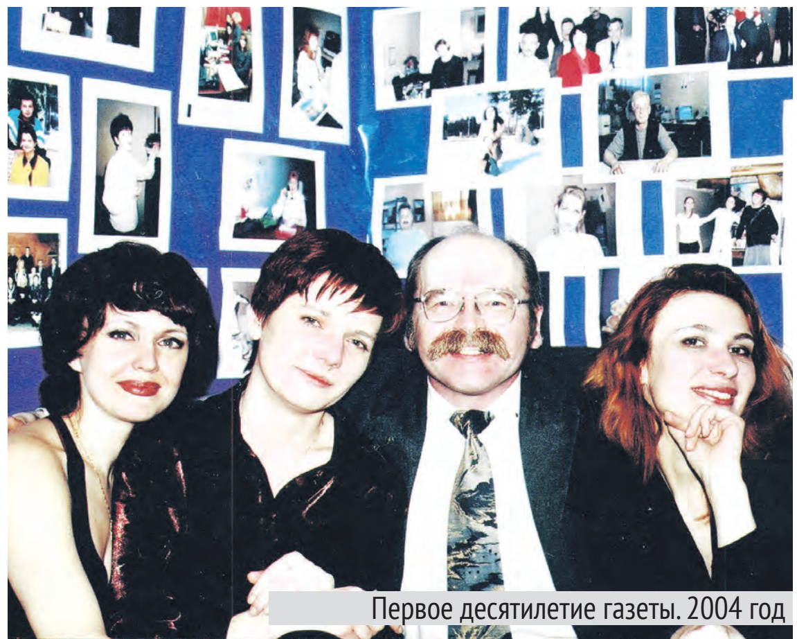
Первое десятилетие газеты. 2004 год