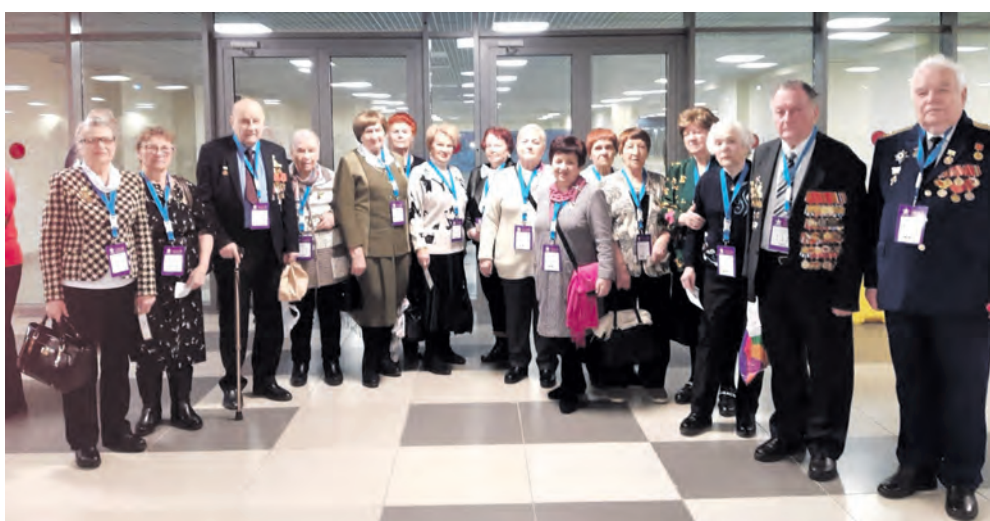
Женсовет совместно с ветеранами на концерте в Газпром Арене