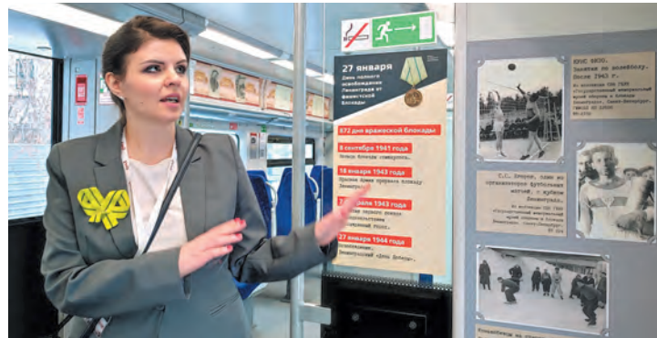
Пассажиры «Ласточки» смогут узнать больше о блокаде и освобождении Ленинграда