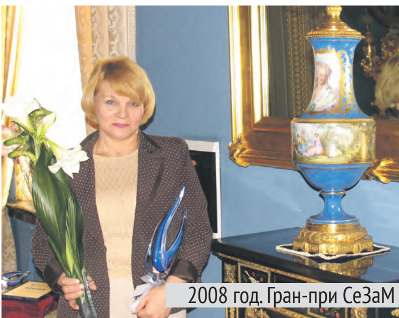
2008 год. Гран-при СеЗам