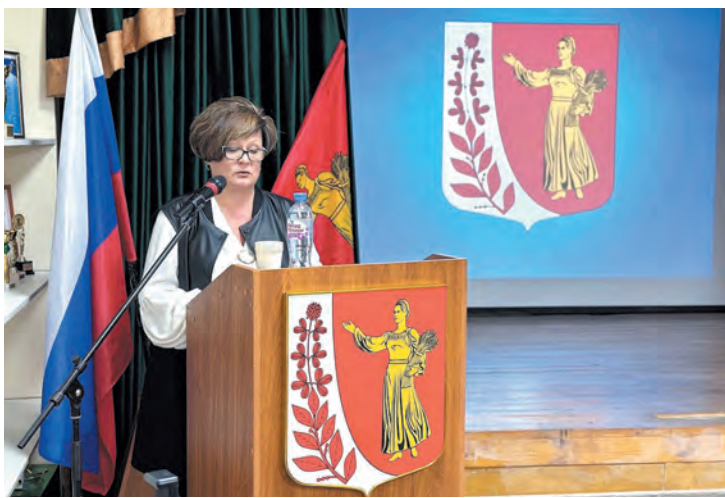
Представители местной власти отчитываются об итогах работы в 2024 году

В поселениях Ленинградской области с января проходят традиционные отчётные собрания. Главы муниципальных образований делятся достижениями за 2023 год, рассказывают о рабочих планах и отвечают на вопросы местных жителей.