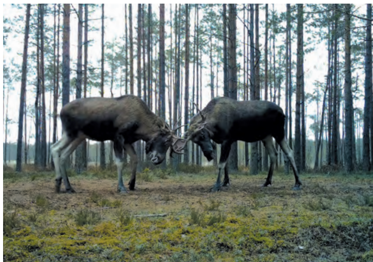
Фотоловушка засняла схватку двух лосей

Удивительно: оружие лосей тоже проходит подготовку перед боем — для того, чтобы рога лучше сцеплялись с рогами соперника, самцы натирают их смолой. Для этого они усиленно трутся своим оружием о стволы сосен: сдирают кору, чтобы выступившая смола попала на рога. В качестве физической подготовки лоси ломают рогами ветки и даже выкорчёвывают небольшие деревца. Если рога были предварительно натёрты смолой, то ветки могут на них застрять и продержаться несколько дней! Пару лет назад мне удалось заснять жениха с подобной короной. И он, я вам скажу, был неотразим! Самка, за которой он ухаживал, явно это оценила. Кстати, и для соперников боец с подобной веточно-кустарниковой композицией на голове выглядит более устрашающим!