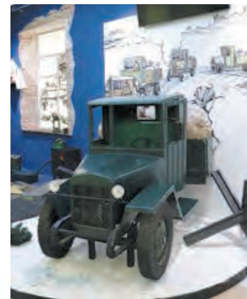
Макет легендарной полуторки с Дороги жизни