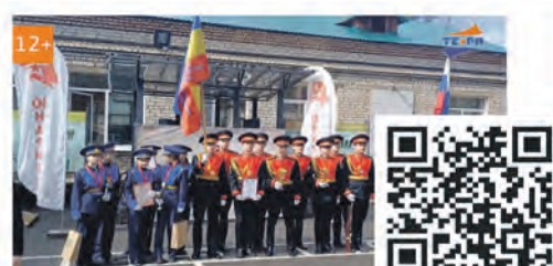
Открытый региональный смотр-конкурс Почетных караулов в центре патриотического воспитания Соснового Бора

Эти сюжеты всегда можно найти в соцсети ВКонтakte, на Youtube и на сайте: www.terastudio.com