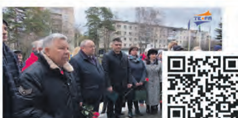
Мемориальная доска посвященная памяти Виктора Тимофеевича Шеянова