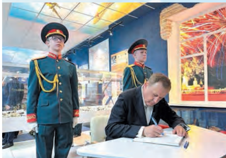
Александр Дрозденко оставил одну из первых записей в книге отзывов школьного музея

Субботники, посвящённые Дню Победы, продлятся в Ленобласти до 8 мая включительно. Все добровольцы получают помощь от местных администраций в виде садового инвентаря, мешков для мусора и вывоза отходов. Узнать больше о субботниках в своём районе можно в группе «Субботники47» во ВКонтакте.