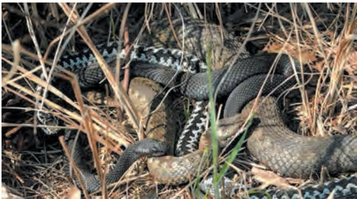
Окрас гадюки может быть разным: от светло-серого до тёмно-бурого

Ужи очень шустрые, прекрасно плавают и ныряют. Снять их на видео не так-то просто. На одной из съёмок на берегу Вуоксы я долго не мог подойти близко к ужам. Завидев меня, они моментально уползли под огромные ледниковые валуны. Вдруг я услышал крик рыбаков... и не поверил своим глазам! Огромный уж тащил только что пойманную одним из мужчин плотву. Змея ловко умыкнула её из садка и пы-