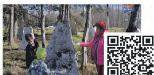
Субботник Общественной палаты Ленинградской области и Соснового Бора