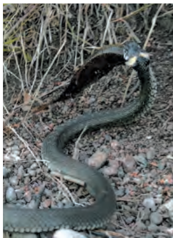
Ужа можно узнать по характерным пятнам на голове