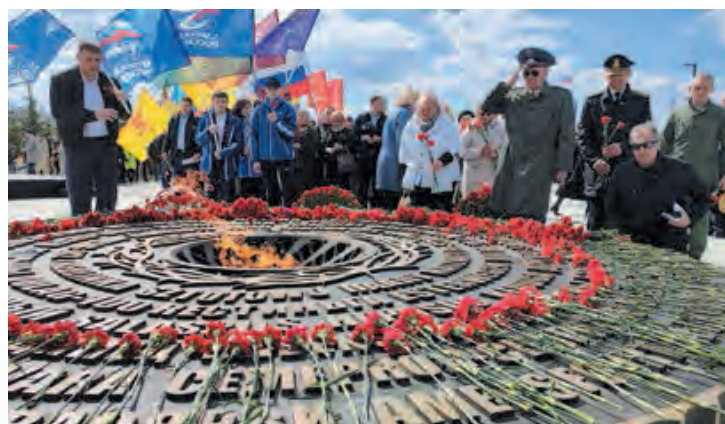
Участники акции почтили память мирных жителей, ставших жертвами фашистского геноцида

Важно, что специалисты из других регионов, которые приезжают к нам, отлично взаимодействуют с местными поисковиками. Работа идёт бок о бок. Это позволяет нам ежегодно поднимать тысячи бойцов и командиров Красной армии, кото-