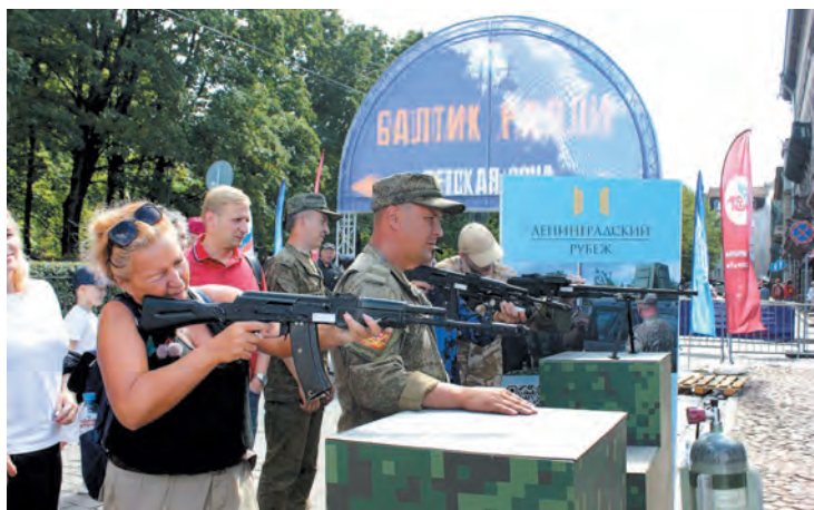
Стенд фонда «Ленинградский рубеж» пользовался популярностью у молодёжи

КСЕНИЯ БОНДАРЕНКО ФОТО АВТОРА, ПРЕСС-СЛУЖБЫ «БАЛТИК РАЛЛИ»