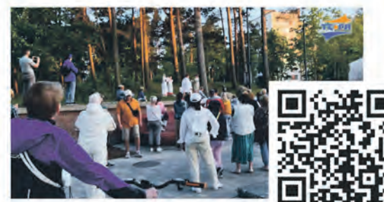
Поэтический перформанс «Энергия улиц» прошел на площади у ДК «Строитель»

Эти сюжеты всегда можно найти Вконтакте, на Youtube и на сайте: www.terastudio.com