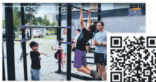
День отца в Сосновом Бору отметили спортивными соревнованиями