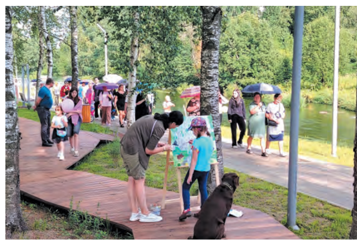
В Гатчинском округе активно идёт благоустройство территорий

Объединение в округ позволит создать более эффективную управленческую команду. Так будет легче и проще готовить документы и проекты для участия в федеральных и региональных программах, а значит — привлекать больше средств для развития территории, реализа-