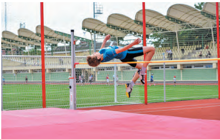
День защиты детей на стадионе «Спартак»

— Это в первую очередь признание эффективности нашей работы — в экономике, финансах, управлении земельными ресурсами и муниципальным имуществом, социальной сфере, ЖКХ, безопасности граждан. Также по результатам 2023 года мы