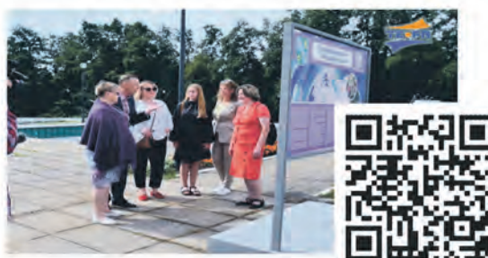
Экспозиция Сосновоборского городского музея «Новый ракурс»