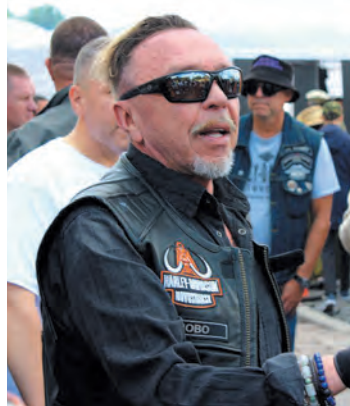
Гарик Сукачёв на патриотическом мото

К слову, вопреки всем санкциям, фестиваль сохранил международный статус. Мы, например, пообщались с байкером из Казахстана Дмитрием Петрухиным.