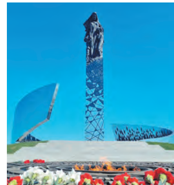
Монумент жертвам геноцида в Зайцево

В округе ведётся капитальный ремонт домов-памятников и реставрация объектов культурного наследия. Долгожданым событием стало открытие Павильона Орла в Дворцовом