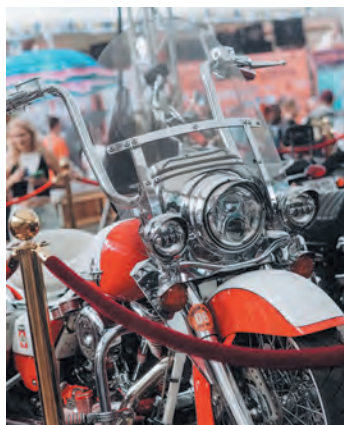
Традиционная выставка ретро-байков

Причём патриотизм — это широкое понятие. Патриотизм — это и любовь к Родине. Кроме того, патриотизм — это пропаганда красоты нашей страны, здорового образа жизни. А байкер — это всё-таки здоровый образ жизни. У нас есть свои принципы. Мы не нарушаем правила. Мы вежливы на трассе. Мы помогаем тем, кто на трассе попал в беду. А самое главное — мы пропагандируем то, что в путешествии ты узнаёшь свою страну. И, конечно, для нас сегодня патриотизм — это поддержка наших ребят в зоне Специальной военной операции. И мы все уверены в нашей Победе.