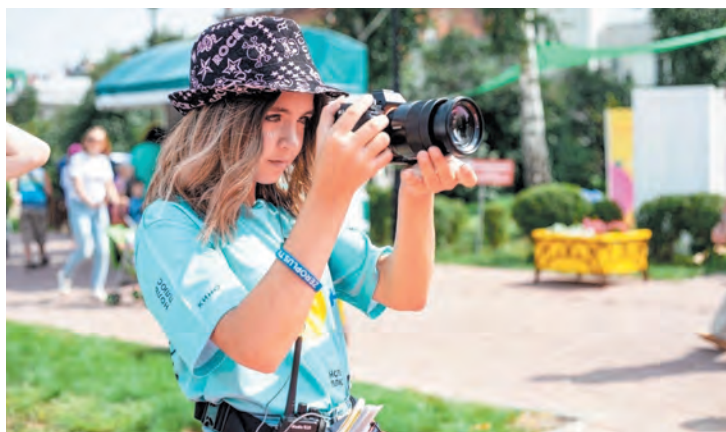
Юные ленинградцы снимают видеоролики о бережном отношении к природе