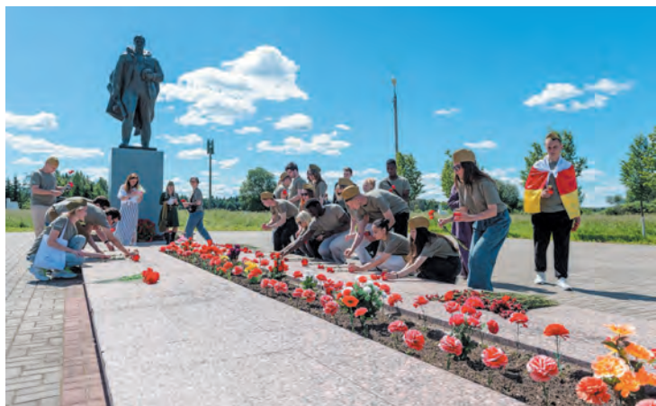
Молодёжь Ленинградской области принимает активное участие в патриотических акциях

БЕСЕДОВАЛА АНАСТАСИЯ КРУГЛОВА