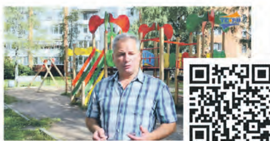
Благоустройство городской среды продолжается в Сосновом Бору