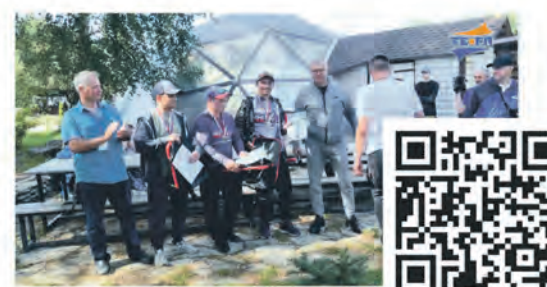
Сосновоборская летняя рыбалка 2024

Эти сюжеты всегда можно найти Вконтакте, на Youtube и на сайте: www.terastudio.com