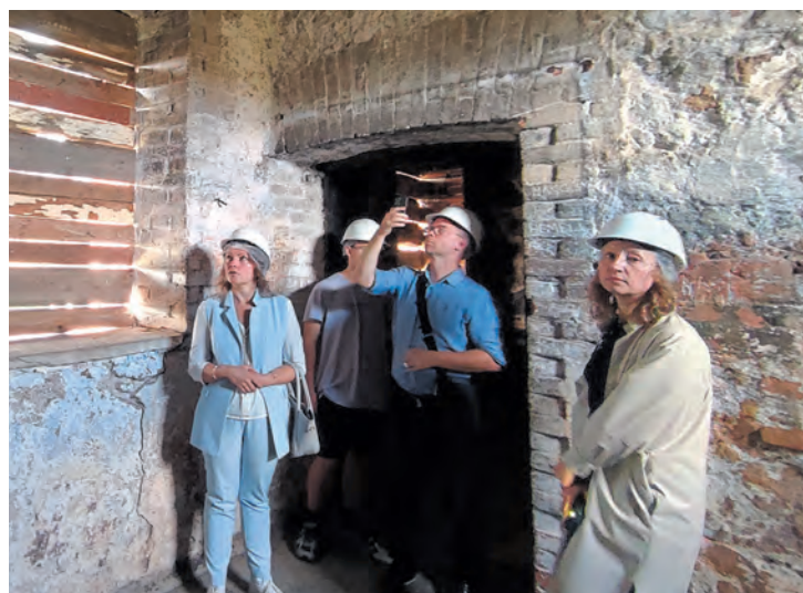
Ранее здесь никогда не проводились комплексные реставрационные работы