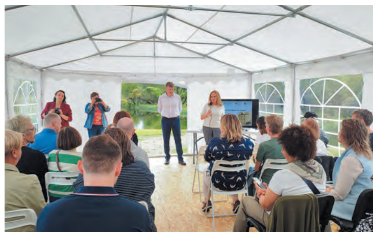
В музейном комплексе обсудили проект восстановления Форелевой башни

ЛЮДМИЛА КОНДРАШОВА