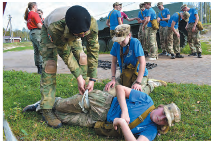
Занятия тактической медициной на «Тропе боевого братства»

среда формирования культурного человека.