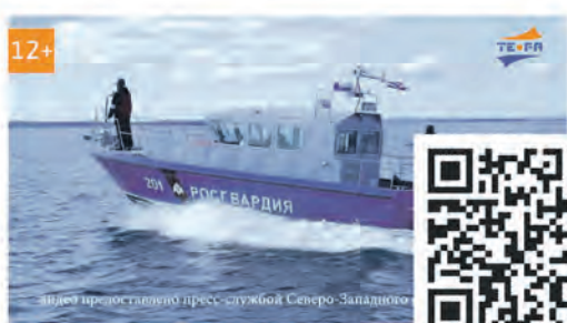
45-летие полка по охране особо важных гособъектов Северо-Западного округа Росгвардии