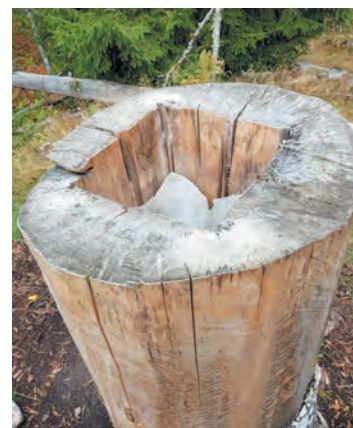
Солонец — лесная подкормка для лесей

необходимые разрешающие документы, добычи при нём не было, документы на оружие тоже были в порядке. Проблем нет, лишь пожелание от Охотнадзора напоследок: «Хорошей добычи».