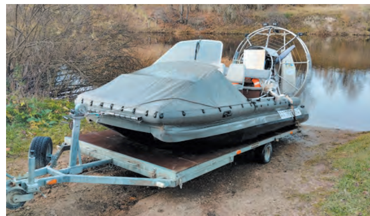
Не только на земле, но и на воде несут свою службу инспекторы Охотнадзора