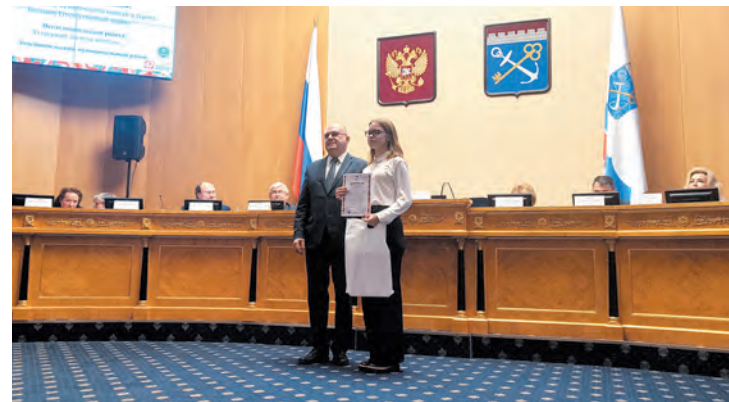
Участниками конкурса стали 38 семей со всей Ленинградской области