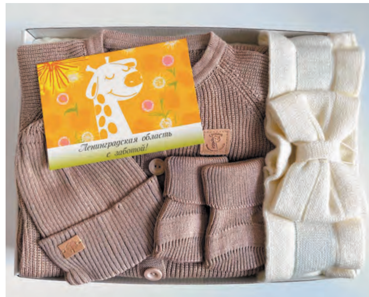
Подарочный набор в рамках акции «Ленинградская область с заботой»

В РАМКАХ АКЦИИ «ЛЕНИНГРАДСКАЯ ОБЛАСТЬ С ЗАБОТОЙ» 115 СЕМЕЙ ПОЛУЧИЛИ ДОПОЛНИТЕЛЬНЫЙ ПОДАРОЧНЫЙ НАБОР