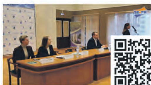
Семинар по охране труда для жителей Соснового Бора