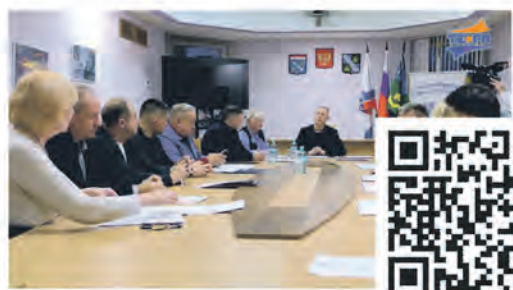
Профильные комиссии при Совете депутатов обсуждают бюджет на 2025 год