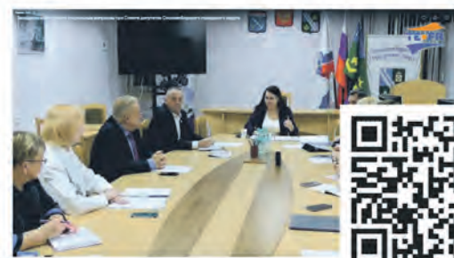
Заседание комиссии по социальным вопросам при Совете депутатов Сосновоборского городского округа

Эти сюжеты всегда можно найти ВКонтakte, на Youtube и на сайте: www.terastudio.com