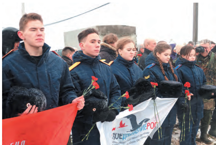
В акции приняли участие представители областных молодёжных и образовательных организаций