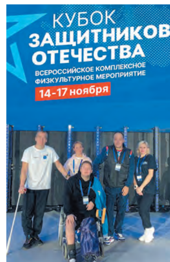
Ленинградцы на церемонии награждения

Татьяна Перова ФОТО: ФОНД «ЗАЩИТНИКИ ОТЕЧЕСТВА»