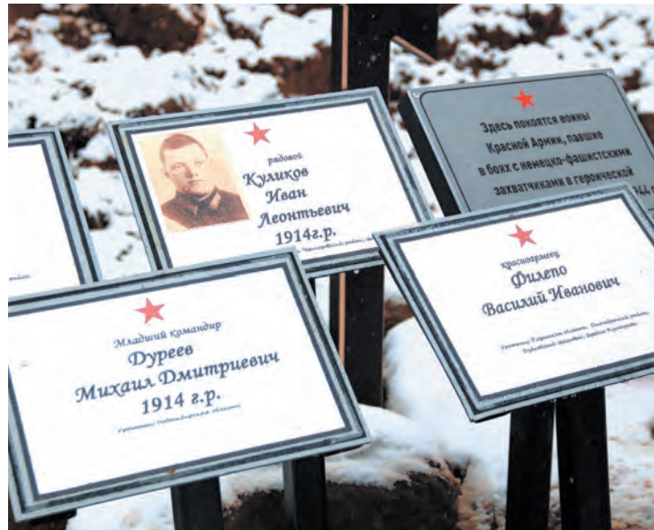
На данный момент установлены личности четырёх человек, погибших в концлагере