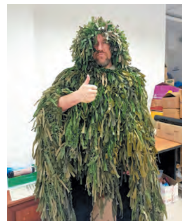
Средства маскировки, предназначенные для бойцов

Вскоре в группе назрела необходимость «выйти в люди» со своим мероприятием, рассказать о себе и своём деле. Первой площадкой стала сцена Пустомержского Дома культуры. Провести спортивно-патриотическое мероприятие с мастер-классами в помощь фронту помогли члены Федерации скалолазания, Пустомержского футбольного клуба, кингисеппские юнармейцы, дзюдоисты из клуба «Прайд», сотрудники ДК и другие неравнодушные жители Кингисеппского района. Выезд получился успешным, волонтеров стали приглашать с мероприятиями в другие поселения района.