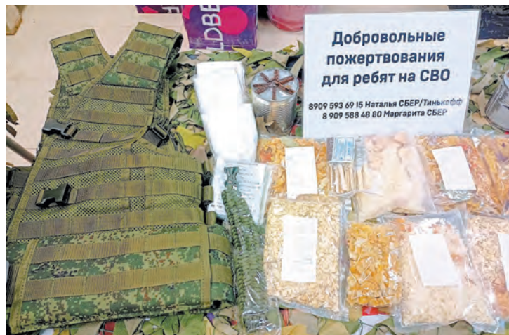
Помощь для военных, собранная руками жителей Кингисеппского района