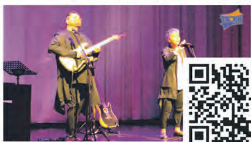
Фестиваль «U-235» и Светлана Сурганова в Сосновом Бору