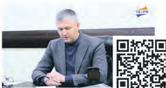
Прямая линия с Главой Сосновоборского городского округа