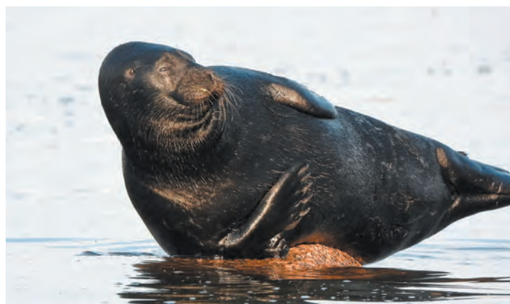
Балтийская кольчатая нерпа

Кого же из морских млекопитающих можно встретить на территории Ленинградской области прямо сейчас? В нашем регионе обитает три подвида: Ладожская кольчатая нерпа, Балтийская кольчатая нерпа и Балтийский серый тюлень. Все они занесены не только в Красную кни-