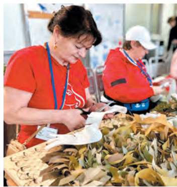
Волонтеры плетут маскировочные сети

Во Всеволожском агро-промышленном техникуме прошёл II ежегодный форум «серебряных» добровольцев «Современные старшие — 2024», цель которого — дать понять людям пожилого возраста, что добровольчество — это не только хорошее дело, но и возможность самореализации. В масштабном мероприятии приняли участие более двух сотен энтузиастов.