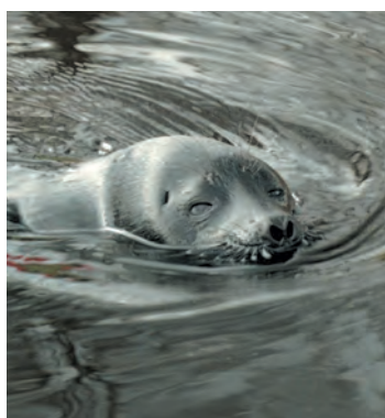
Ладожская кольчатая нерпа

По видео учёные смогли определить вид животного — оказалось, что это горбатый кит. Данный вид китов можно встретить в любой точке мирового океана, однако в Балтийское море он заплывает крайне редко: за всю историю наблюдений учёными зафиксированы лишь единичные случаи. Так, в водах Финляндии горбатый кит был замечен в 2006 году, в Латвии — в 2007-м, в Польше — в 2008-м и в 2015-м, и в Швеции — в 2014 году.