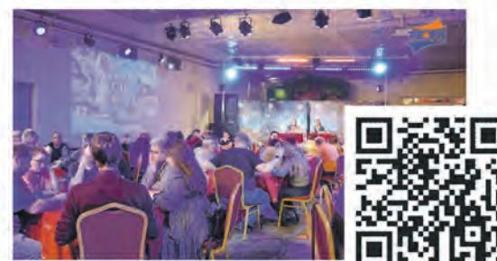
«Что? Где? Когда?»

Эти сюжеты всегда можно найти ВКонтakte, на Youtube и на сайте: www.terastudio.com