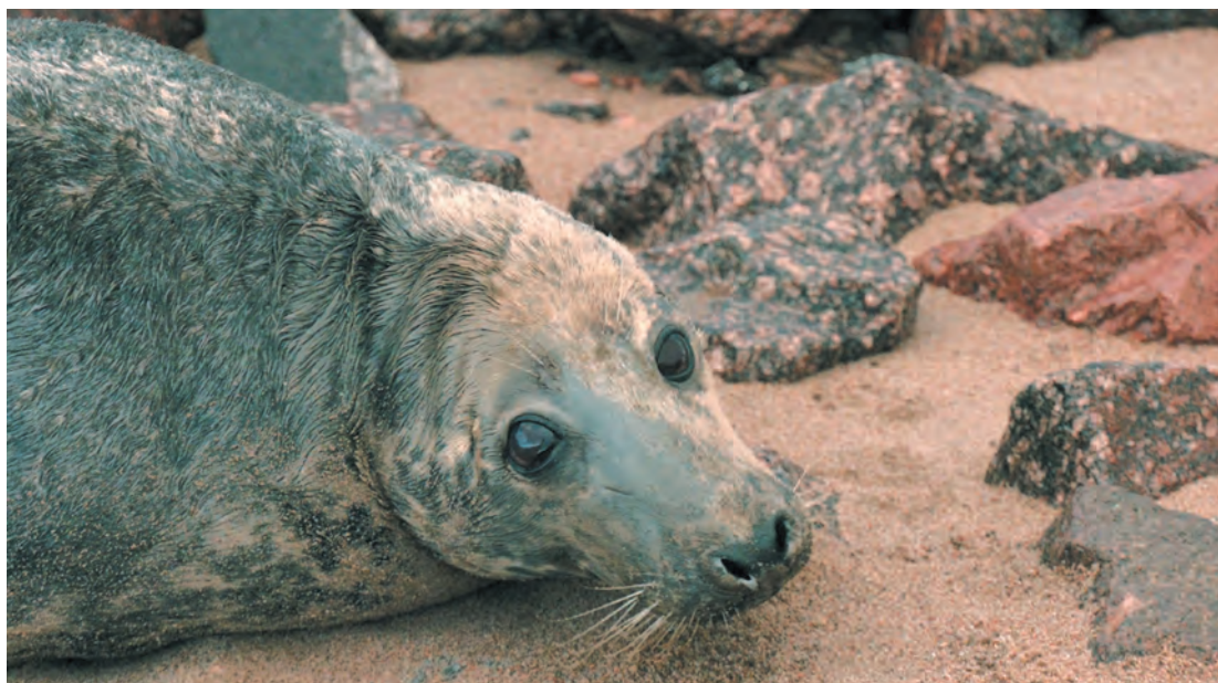
Балтийский серый тюлень