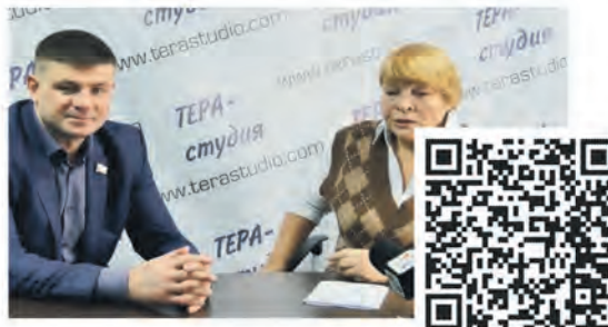
Интервью с депутатом Вадимом Артемьевым