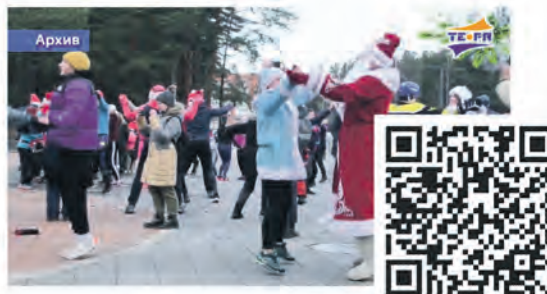
Новогодняя пробежка 2025