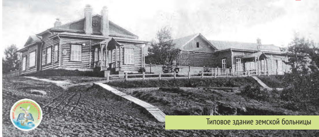
Типовое здание земской больницы

2024 год был юбилейным для нашей медсанчасти, она отметила 55-летний юбилей со дня образования. Сегодня ЦМСЧ № 38 ФМБА России — это многопрофильное лечебно-профилактическое учреждение, оснащённое инновационным оборудованием, обеспечивающее помощь работникам 42 прикрепленных предприятий и всему населению города. В ее состав входят две поликлиники — детская и городская — а также женская консультация, родильный дом, стационар, диагностические и вспомогательные отделения, здравпункты.