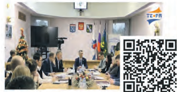
Заседание совета депутатов

Эти сюжеты всегда можно найти ВКонтakte, на Youtube и на сайте: www.terastudio.com