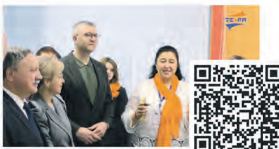
Медиа студия «СЛОИ» открылась в Центре развития творчества