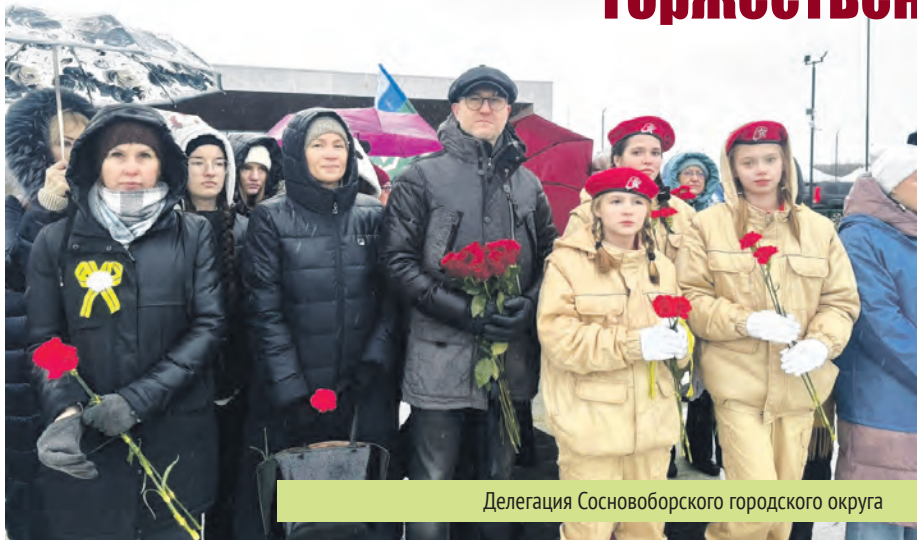
Делегация Сосновоборского городского округа

27 января на территории мемориала в Зайцево Гатчинского округа стартовала торжественно-траурная церемония под названием «Слава, которой не будет конца!», посвященная памяти мирных жителей СССР, погибших во время Великой Отечественной войны. Церемония была организована в честь 81-й годовщины полного снятия блокады Ленинграда.