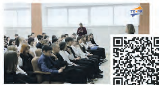
Семинар о добровольчестве в центре «Диалог»

Эти сюжеты всегда можно найти ВКонтakte, на Youtube и на сайте: www.terastudio.com