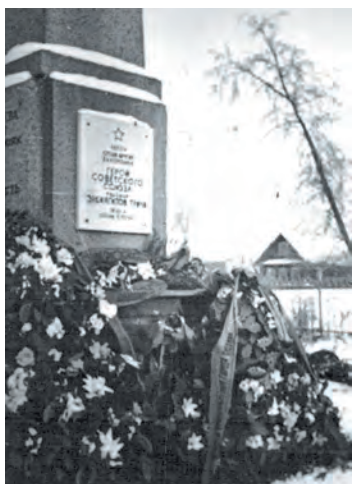
Братская могила в г. Любань, где похоронен Туйчи Эрджигитов

В начале конференции участникам показали документальный фильм, смонтированный на основе советской кинохроники. И среди многих лиц и имён воз-