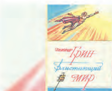
Лекция о творчестве Александра Грина