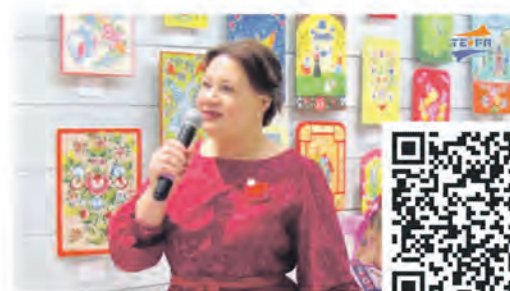
Выставка «Краса ненаглядная»