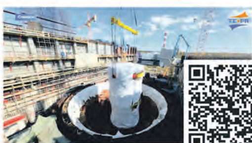
Программа «Страна Росатом»