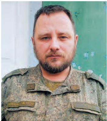
Поэт Евгений Халамов

В ближайшее время книга «Чтобы знали. Продолжение»