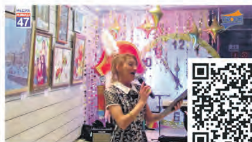
Выставка «Ах, ты зимушка-зима»

Эти сюжеты всегда можно найти ВКонтakte, на Rutube и на сайте: www.terastudio.com