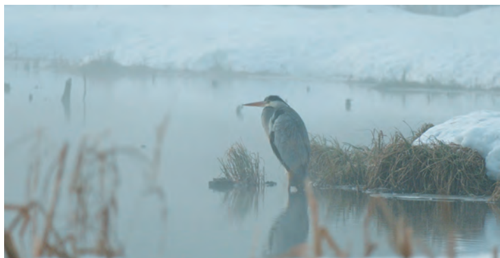
Серая цапля зимой в Гатчинском округе

Цапли ведут дневной образ жизни. Предпочитают крупные водоёмы с мелководьями, подходящими для рыбалки, — это могут быть реки с низкими заросшими берегами, озёра и пруды. При этом гнездиться они могут в некотором отдалении от воды.