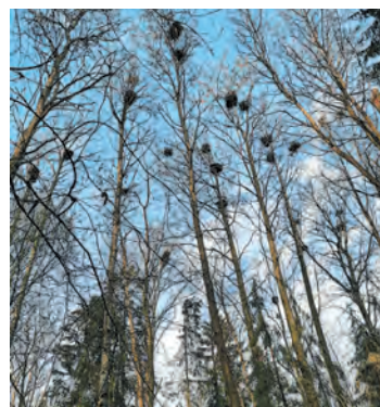
Гнезда в цапельнике

Интересно, что уже не первый год в Ленинградской области обнаруживается несколько мест (в том числе, два — в Гатчинском округе), где серые цапли остаются зимовать. В каждом