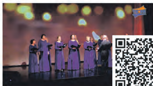
Праздничный концерт посвященный Дню Героев Отечества