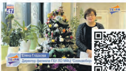
Акция "Сытый Новый Год" в МФЦ