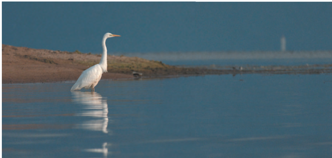
Белая цапля на Финском заливе в Ломоносовском районе Ленинградской области