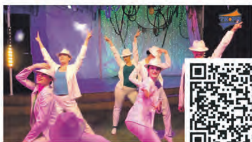
Вокально-танцевальный вечер "В гостях у Легенды"