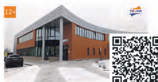
Доступная среда в Сосновоборском МФЦ

Эти сюжеты всегда можно найти ВКонтakte, на Rutube и на сайте: www.terastudio.com