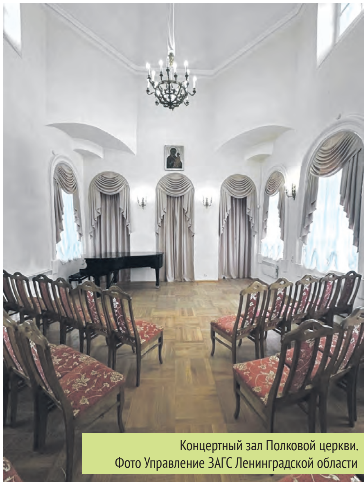
Концертный зал Полковой церкви.

Ирина ПАВЛОВА, газета РгоОтрадное