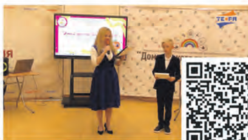
Творческий фестиваль «Атом должен быть рабочим»