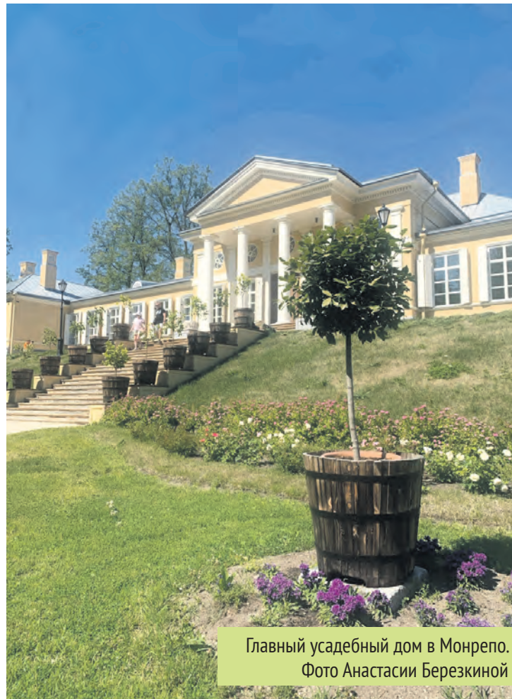
Главный усадебный дом в Монрепо.

«Одной из самых популярных площадок в 2025 году оказался «Домик на пристани» в Шлиссельбурге. Коллеги из Кировского района отлично отработали сезон, и уже сейчас принимают заявления на сезон 2026 года. И стоит отметить, что желающих уже очень мно-