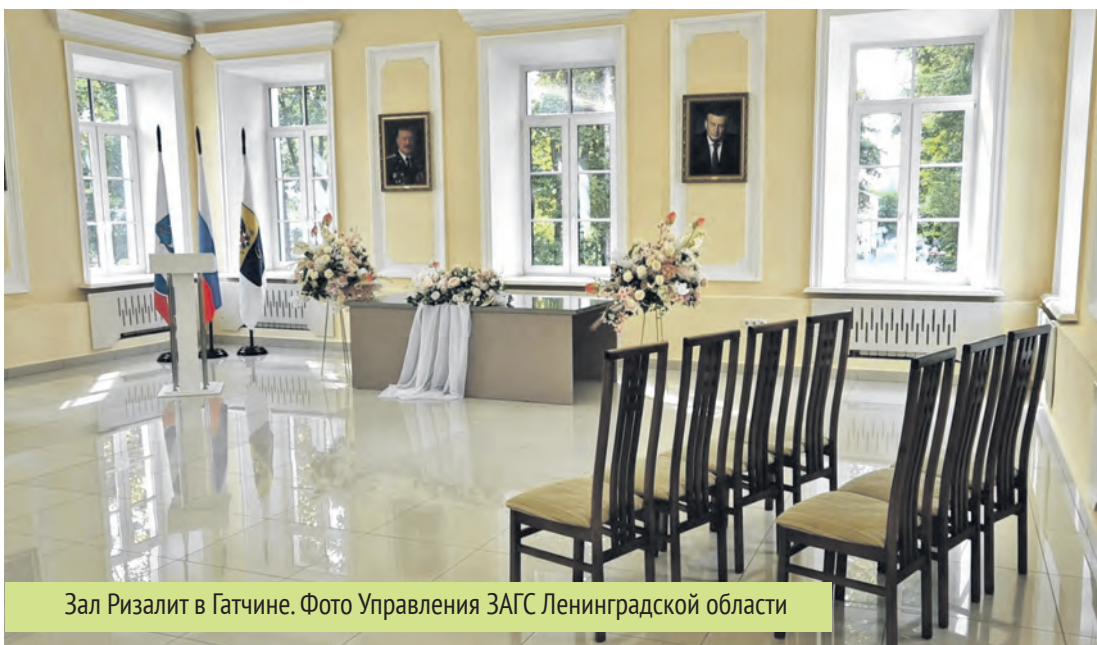
Зал Ризалит в Гатчине.