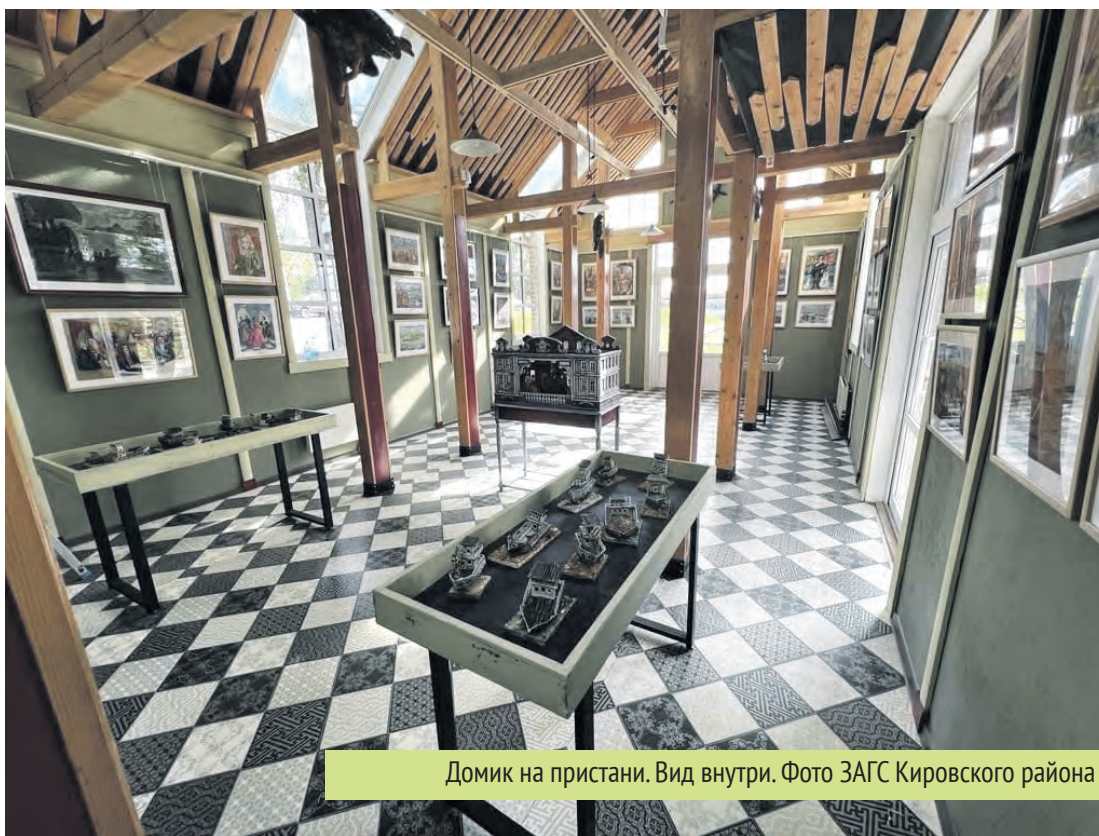
Домик на пристани. Вид внутри.

«Мы предлагаем молодожёнам два пространства. Одно из них — сквер перед бюстом Николая Андреевича — это необыкновенной красоты площадка, где декорацией служит потрясающий вид на Тихвинский Богородичный Успенский мужской монастырь. Вторая площадка — Церковь Всех Святых (Полковая). Это здание XVIII века с необыкновенной атмосферой и потрясающей акустикой, которое уже более 60 лет является концертным залом Дома-музея Н.А. Римского-Корсакова», — рассказала Анастасия Романовна.