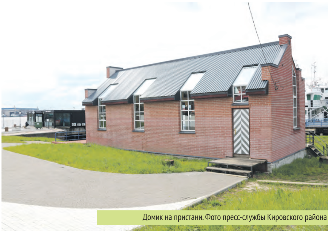
Домик на пристани.