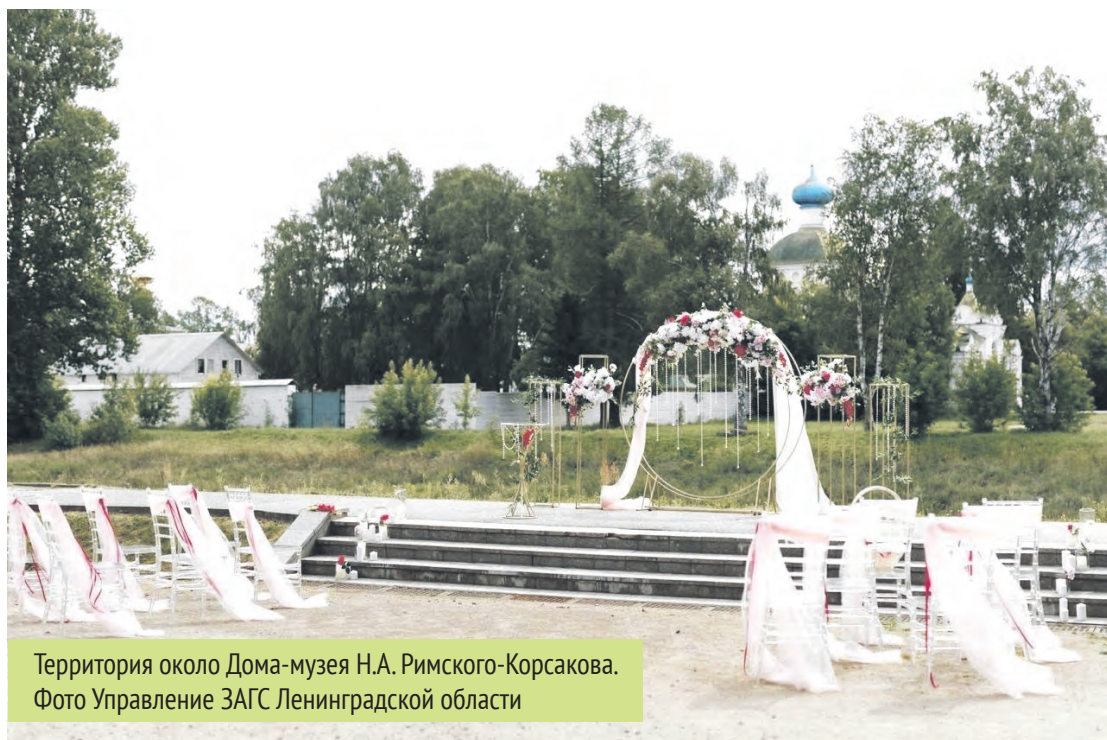
Территория около Дома-музея Н.А. Римского-Корсакова.

Сыграть пышную свадьбу в интерьерах XVIII века, сказать друг другу заветные слова в местах, где когда-то прогуливались Николай Римский-Корсаков или Николай Рерих — всё это стало возможным благодаря проекту по организации выездных церемоний бракосочетания «Магия музейной свадьбы» на площадках Ленинградской области. Об особенностях проекта, потенциале музеев в сфере свадебного туризма, новых локациях для проведения брачных церемоний и свадебных тенденциях говорили на пресс-конференции в пресс-центре ТАСС в Санкт-Петербурге.