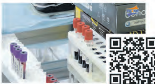
Вопросы здравоохранения обсудили на заседании Общественной палаты