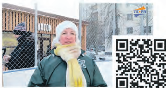
Фестиваль здоровья для молодежи