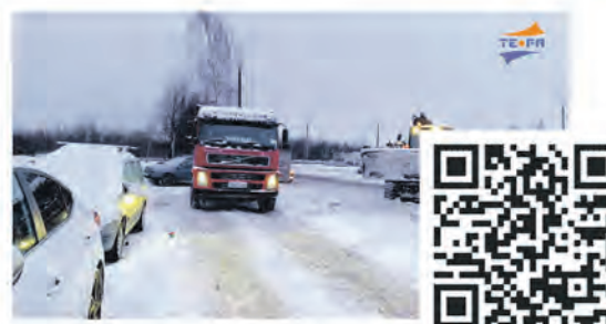
Плановая уборка снега

Эти сюжеты всегда можно найти ВКонтakte, на Rutube и на сайте: www.terastudio.com