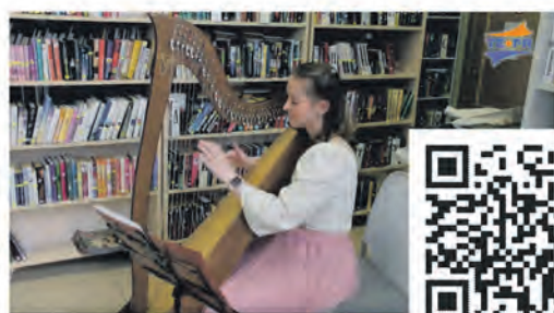
Музыка струн в библиотеке "Точка Сбора"