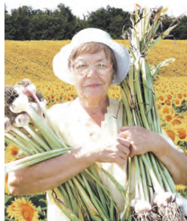
Рубрику ведёт Надежда Полторацкая