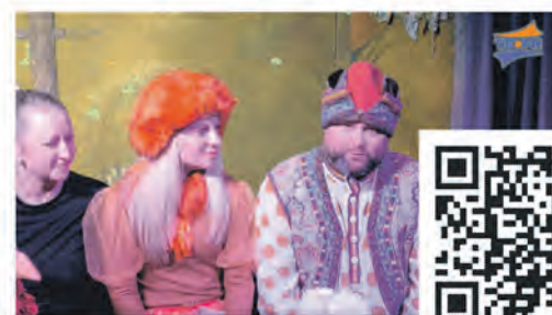
Юбилейный спектакль «Теремок»