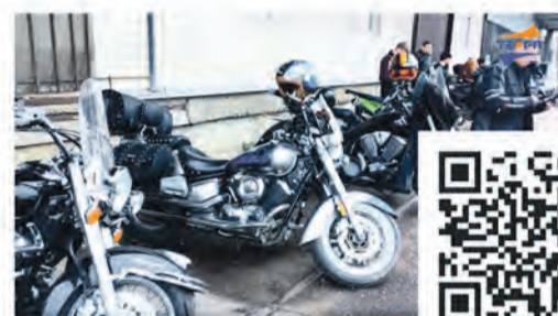
Открытие мотосезона в Сосновом Бору

Эти сюжеты всегда можно найти ВКонтakte, на Rutube и на сайте: www.terastudio.com