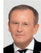
АЛЕКСАНДР ДРОЗДЕНКО, ГУБЕРНАТОР ЛЕНИНГРАДСКОЙ ОБЛАСТИ

Вы сами определяете приоритеты, решаете, что появится в ваших населённых пунктах, а наша задача — профессионально и качественно эти идеи воплотить. Каждый голос — это выбор в пользу уютных скверов у дома, современных набережных и благоустроенных парков, где гуляют дети и родители, бабушки и дедушки.