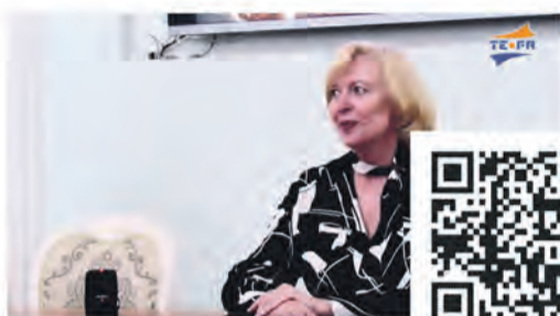
Я планирую бюджет