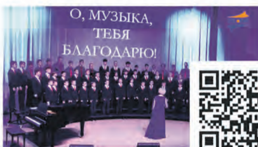
Концерт хора мальчиков в СДШИ "Балтика"